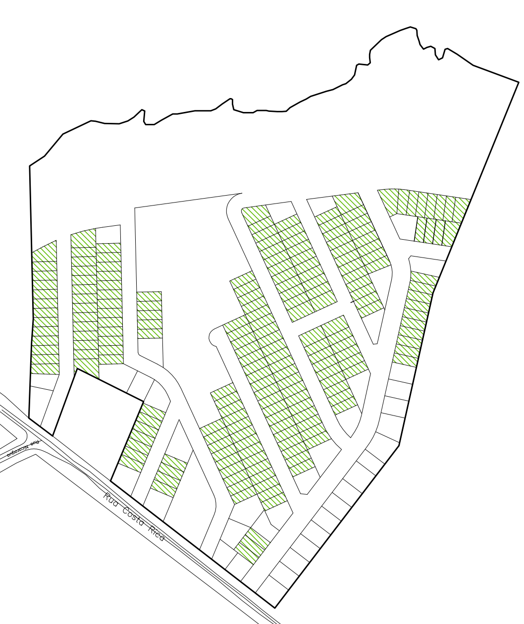
ÁREAS DE LOTES – PMCMV 30.980,73m²

ÁREA REMANESCENTE DA MATRÍCULA 5.420 51.108,11m²